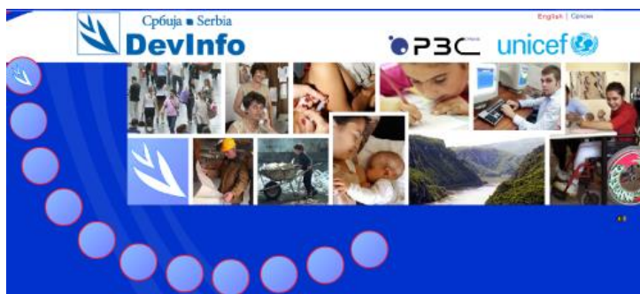
Слика 1. Почетна страна галерије

На почетној страни Галерије (Слика 1), са леве стране слика налазе се кругови који су интерактивни и представљају једну од области.